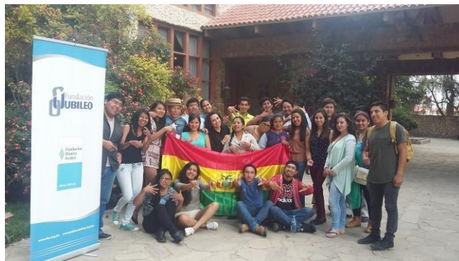
Segundo Encuentro RELIDD