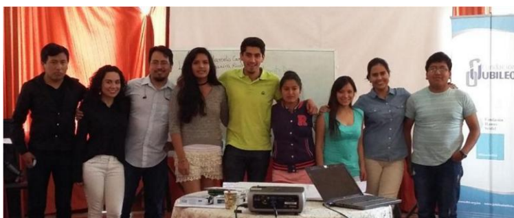
Equipo de Coordinación RELIDD