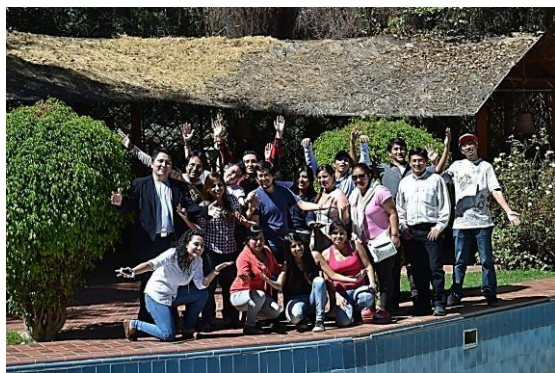
Primer Encuentro RELIDD